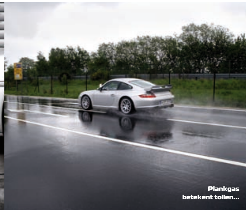
Plankgas betekent tollen...