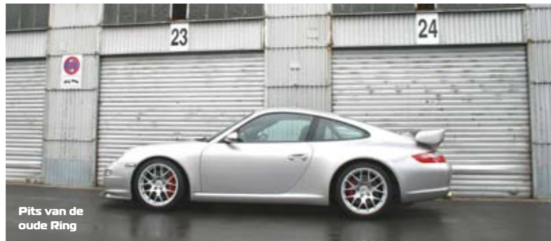
Pits van de oude Ring